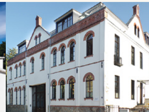
Ansicht Zweinaundorfer Straße